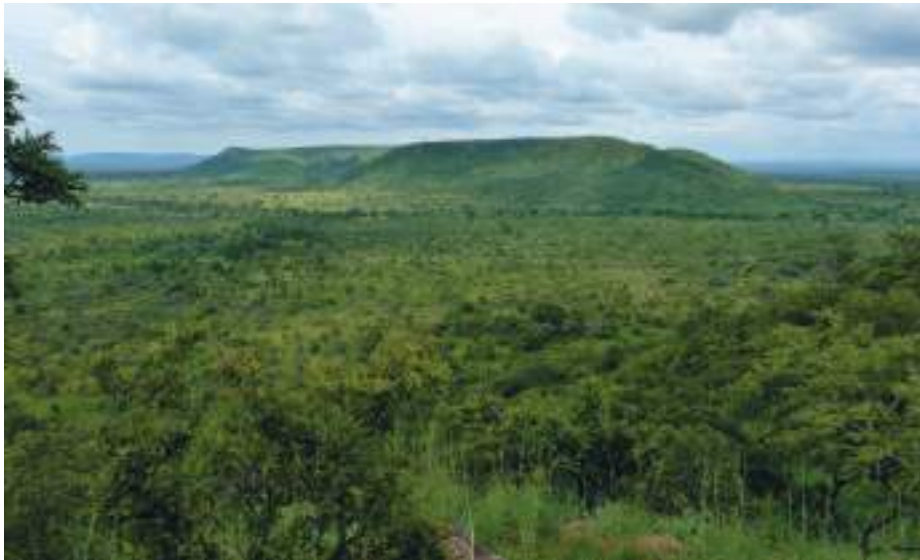
Planche 4. Paysage de la Réserve de Biosphère de la Pendjari, une mosaïque de formations végétales

Buem, plus réduite est parallèle à la première. En raison de sa faible perméabilité, la pénéplaine est soit inondée en saison pluvieuse, soit gorgée d'eau rendant toute circulation en véhicule impossible hors des pistes.