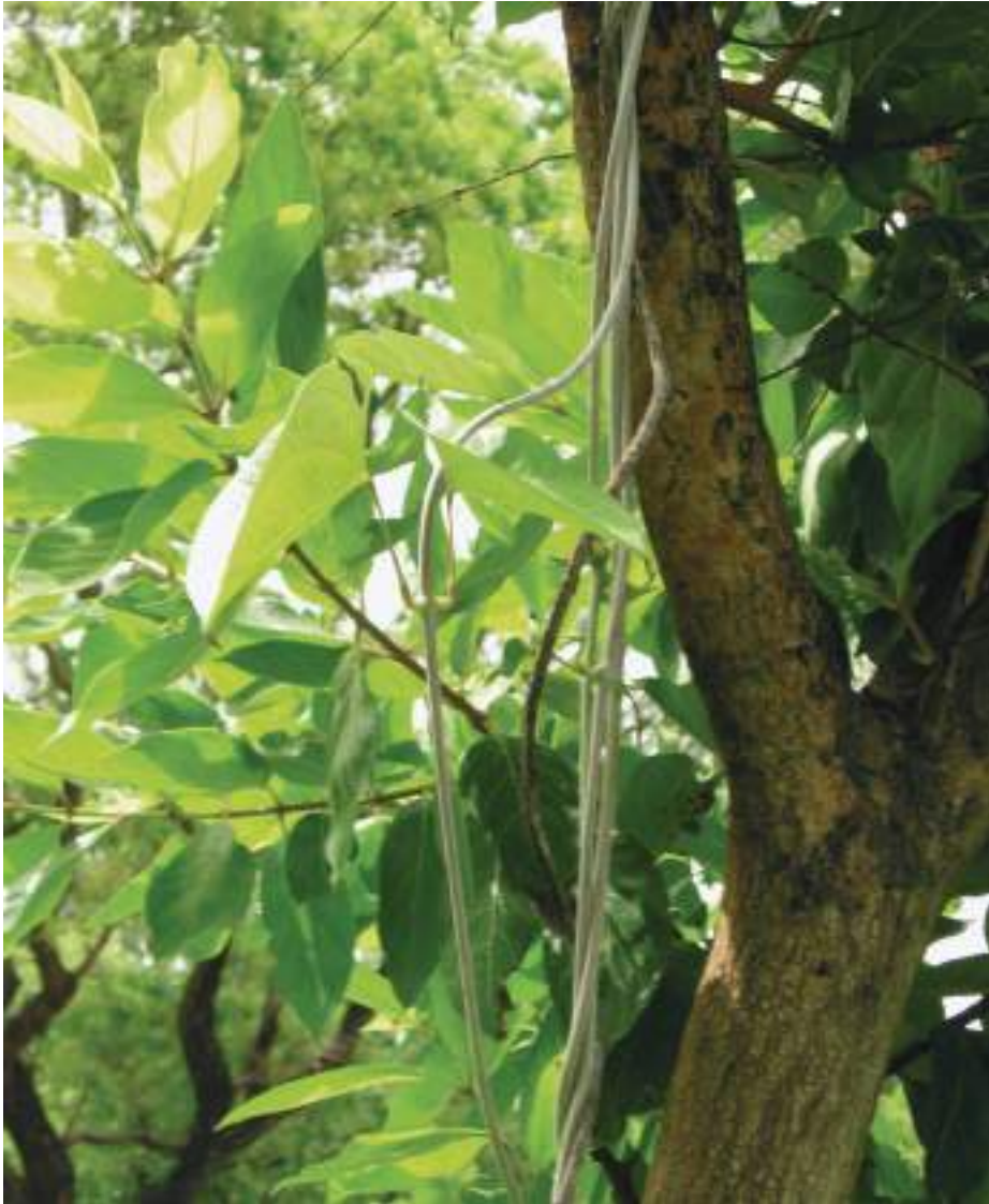
Planche 16. Crossopteryx febrifuga , qualifiée de boussole du chasseur par les populations locales de la Pendjari ; la fourche du tronc indiquerait la direction du Nord.