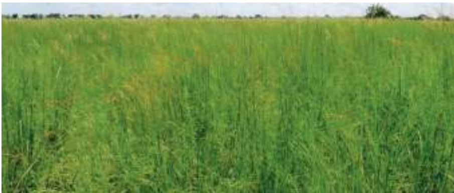
Planche 5. Savane herbeuse à Brachiaria jubata et Panicum subalbidum , plaine d'inondation de la mare Sacrée RBP.

La savane herbeuse est un tapis de grandes herbes dominées par des graminéens. Les arbres sont absents ou recouvrent moins de 10% du sol. Elle est verdoyante après le passage des feux au pic de la reprise de la végétation. La hauteur des herbes varie entre 80cm sur les plateaux et plus de 2m dans les zones humides situées le long des cours d'eau, les bas-fonds et les plaines d'inondation. La savane herbeuse est dite marécageuse lorsque la période d'inondation dépasse six mois. Dans ce cas, les espèces d'herbes fréquentes sont Panicum subalbidum (Pl. 5), Vetiveria fulvibarbis (Pl. 6, a et b), Hypharrenia glabriuscula , Eragrostis atrovirens (Pl. 7, a et b), et Oryza barthii . On y rencontre en l'occurrence dans les savanes marécageuses des espèces rares comme l'orchidée terrestre Platycoryne paludosa (Pl. 8, a et b).