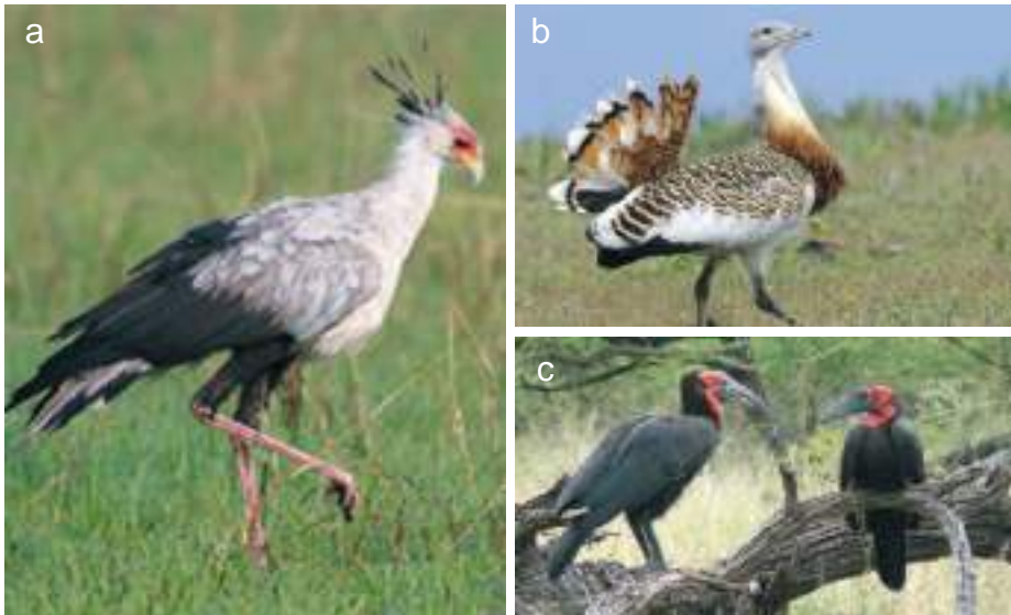
Planche 40. Sagittarius serpentarius (a), le messager serpenteire, dans la plaine d'inondation proche de la Yanguali.

Trois cent soixante dix huit espèces d'oiseaux ont été identifiées dans la RBP (Adjakpa, 2003) dont 120 espèces forestières, 101 espèces aquatiques, 162 espèces vivant dans les zones riveraines de la Réserve et trois espèces vivant dans les roches et montagnes. Cent soixante trois espèces sont migratrices dont 63 en provenance d'Europe, d'Afrique du Nord et de la partie nord du Sahel. La RBP a donc une grande importance pour les oiseaux de passage en provenance de ces contrées durant l'hiver. Les planches 40a, b et c ; 41a, b, c et d illustrent quelques uns des oiseaux reconnus dans la Réserve.