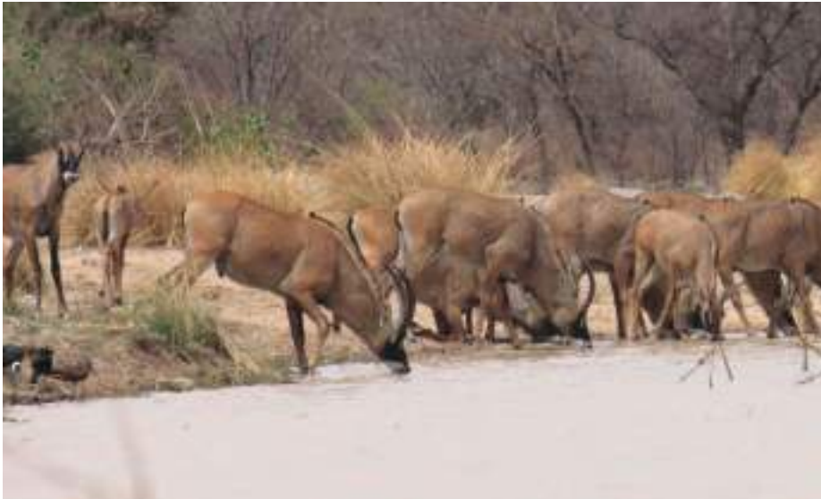
Planche 43. Hippotragus equinus , l'antilope cheval, venus boire à la mare Bali dans le Parc National de la Pendjari.

Les savanes boisées sont très fréquentées par l'éléphant (Pl. 44b). Les densités de ces animaux sont vraisemblablement déséquilibrées par rapport à leurs habitats, en témoignent notamment la destruction du baobab (Pl. 45).