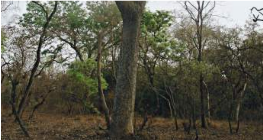
Planche 29. Galerie forestière de la plaine d'inondation au niveau de la mare Yangouali dans la RBP. Daniellia oliveri est le grand arbre visible à l'avant-plan sur la photo. (© Agbani 2010).

Exceptionnellement, la forêt s'étend sur une largeur de plus de 2 km à partir de cours d'eau, notamment à Bondjagou. A ce niveau il s'agit d'une forêt riveraine (Pl. 30a). La hauteur des arbres les plus fréquents ( Cola laurifolia , Parinari congensis , Khaya senegalensis , Daniellia oliveri , Anogeissus leiocarpus ) varie suivant l'espèce d'arbre dominante. Leurs cimes se touchent. Le recouvrement de cette végétation est supérieur à 90% de la superficie où elle été observée, la pénétration de la lumière dans le sous-bois est faible (Pl. 30b).