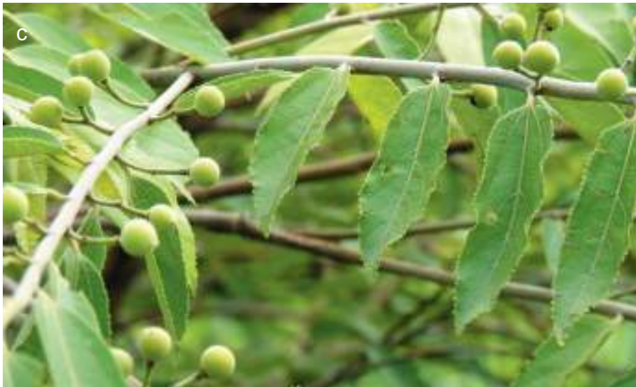
Planche 10. Annona senegalensis ssp. senegalensis observée dans la savane arbustive du noyau central de la RBP: fruits vert (b) et mûr (a).

Grewia bicolor (c), arbuste fréquent surtout dans les savanes arbustive et arborée au niveau du noyau central de la RBP.