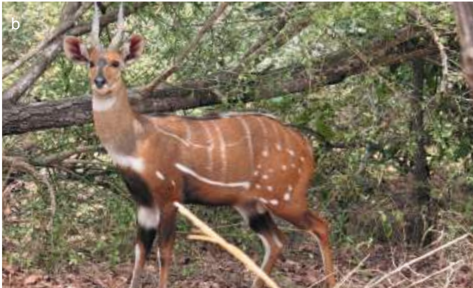
Planche 36. Redunca redunca (a), le cobe de roseaux. Tragelaphus scriptus (b), le guib harnaché, sur les rives de la rivière Pendjari. foto DPNP, 2012.