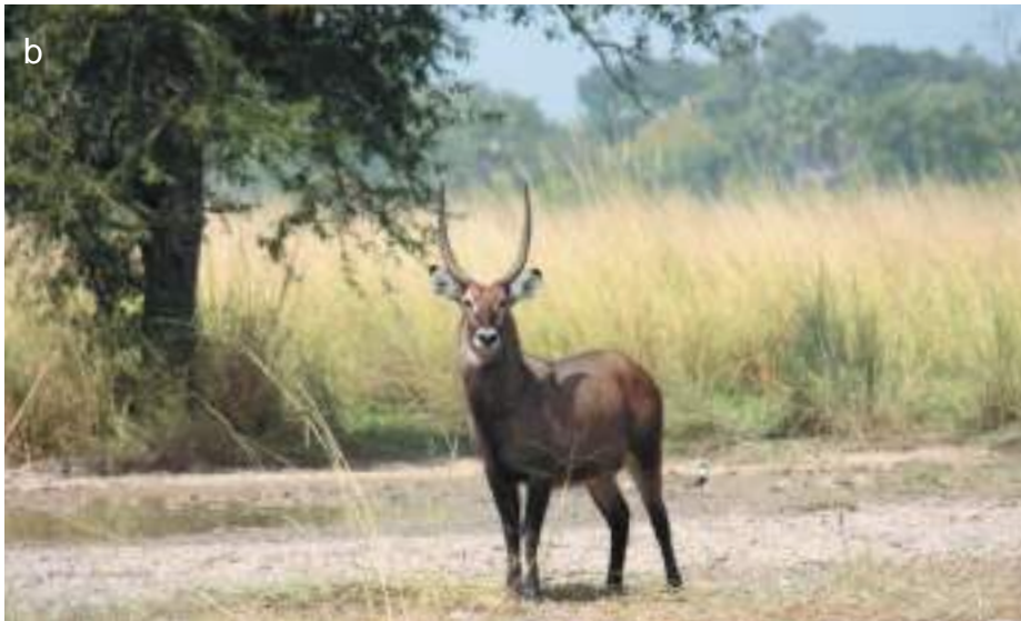
Planche 35. Kobus ellipsiprymnus , le cobe defassa, encore appelé cobe onctueux ou waterbuck, vers la mare Bali (a) ; au niveau du circuit Fogou (b).