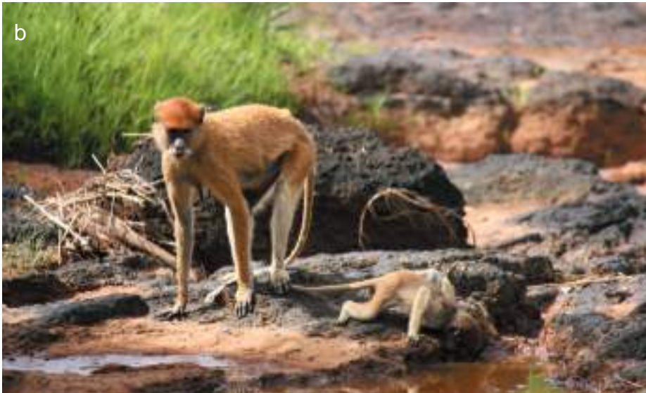
Planche 39. Papio anubis (a), le babouin, dans une savane herbeuse sur le circuit Fogou RBP.

Erythrocebus patas (b), le singe rouge, observé au niveau de la mare rocheuse au début de la piste Bali-Sacrée.