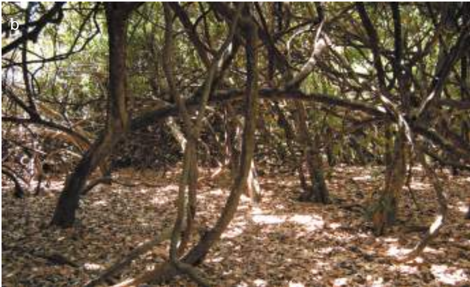
Planche 30. Vue globale sur l'enclave de forêt riveraine de Bondjagou (a), prise à partir du pont de Kokoumbéré. (© F. Muhashy 2014)

Sous-bois dans l'enclave de forêt riveraine (b) de Bondjagou. (© F. Muhashy 2014)