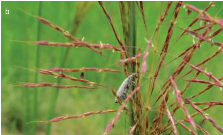
Planche 6. Savane herbeuse à Vetiveria fulvibarbis sur le circuit Fogou RBP : vue globale (a) ; V. fulvibarbis en fleur (b).