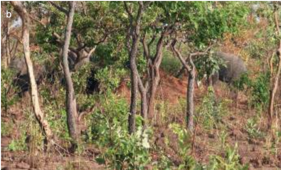
Planche 44. Hippopotamus amphibius (a), hippopotames dans la rivière Pendjari. Sur la rive se distingue une forêt ripicole à Crataeva adansonii et Vitex chrysocarpa . Eléphants dans une savane boisée (b).