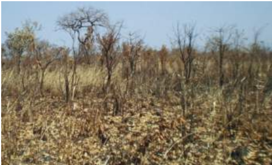
Planche 9. Savane arbustive observée après qu'elle ait été soumise aux feux en saison sèche ; Zone Cynégétique de la Pendjari, RBP.