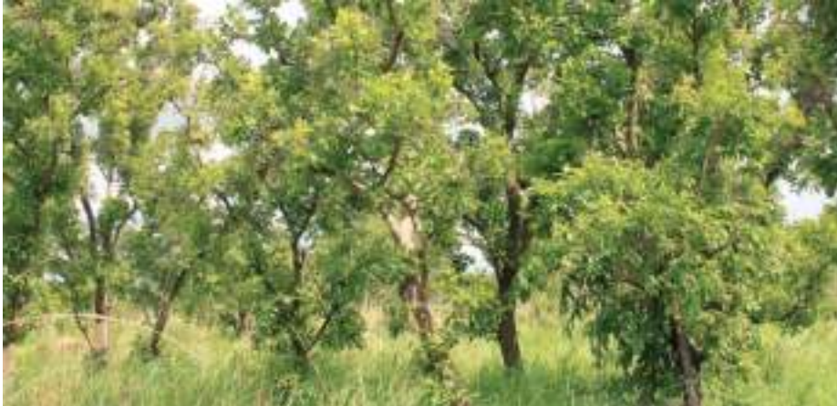
Planche 15. Savane arborée à Crossopteryx febrifuga sur un sol gravillonnaire dans la RBP.