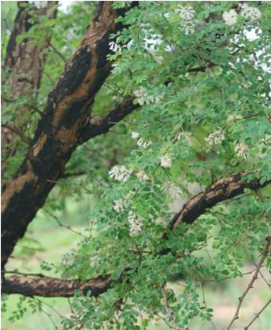
Planche 47. Acacia gourmaensis dans la zone cynégétique de la Pendjari, piste de chasse de Batia, RBP.