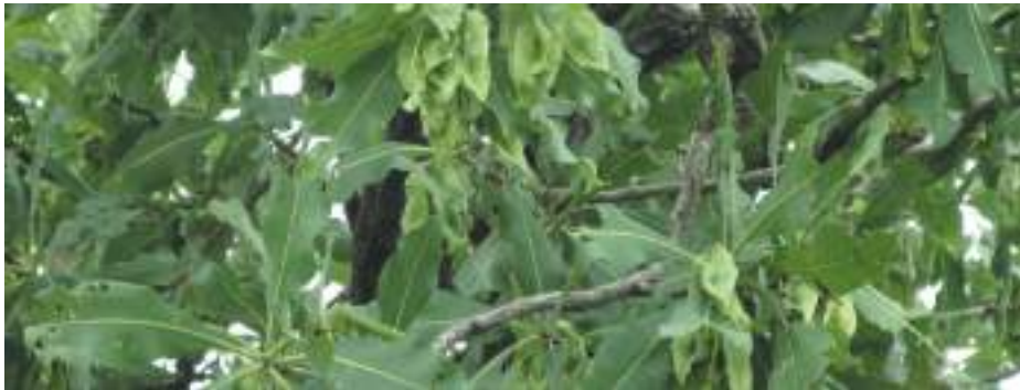
Planche 18. Terminalia macroptera Guill. & Perr. , arbre dominant des savanes arborées humides de la RBP. Tronçon mare Sacrée - mare Yangouali.