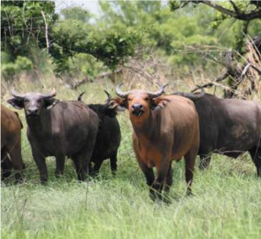
Planche 32. Syncerus caffer , le buffle d'Afrique, dans une savane herbeuse près d'une savane arborée située à l'intérieur du noyau central de la Pendjari, RBP.