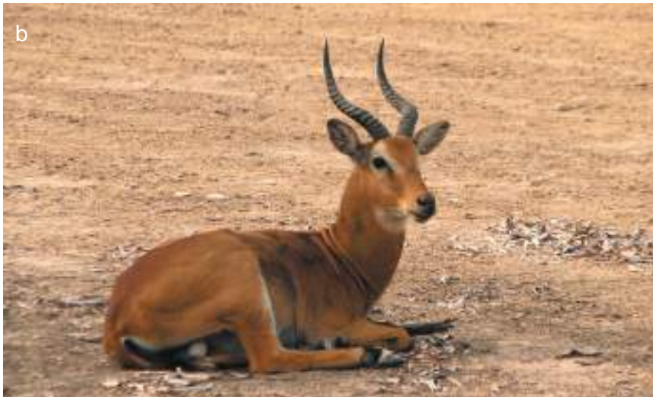
Planche 34. Kobus kob ; le cobe de Buffon en groupe (a), observé dans la plaine d'inondation de la rivière Pendjari après le passage du feu.

Kobus kob , le cobe de Buffon, mâle au repos (b). Photo DPNP, 2012.