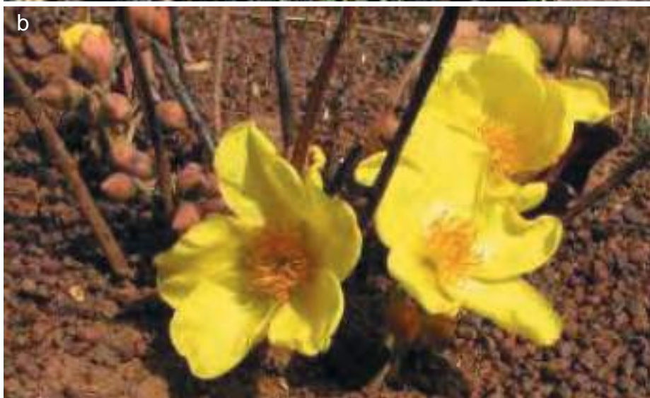
Planche 46. Des repousses (a) après un feu précoce dans la RBP en 2015.

Fleur de Cochlospermum tinctorium (b) s'ouvrant après le passage du feu dans la RBP en 2004.