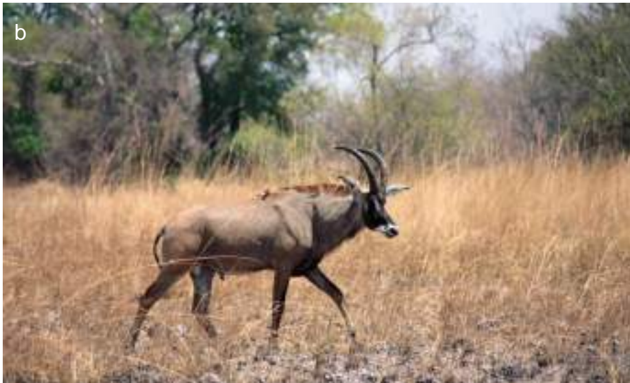
Planche 33. Hippotragus equinus ; antilopes cheval en groupe (a) s'abreuvant. Antilope cheval (b) : individu. Photo DPNP, 2012.