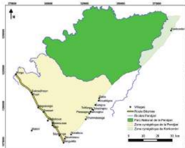
Planche 2. Carte de la Réserve de Biosphère de la Pendjari : Localisation au Bénin (a) et quelques détails (b).