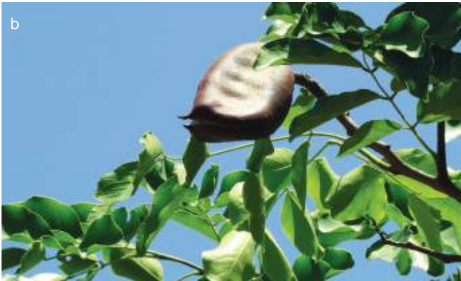
Planche 21. Afzelia africana ; feuilles et fruit (a et b) sur la piste de la Bondjagou, noyau central de la Pendjari, RBP.