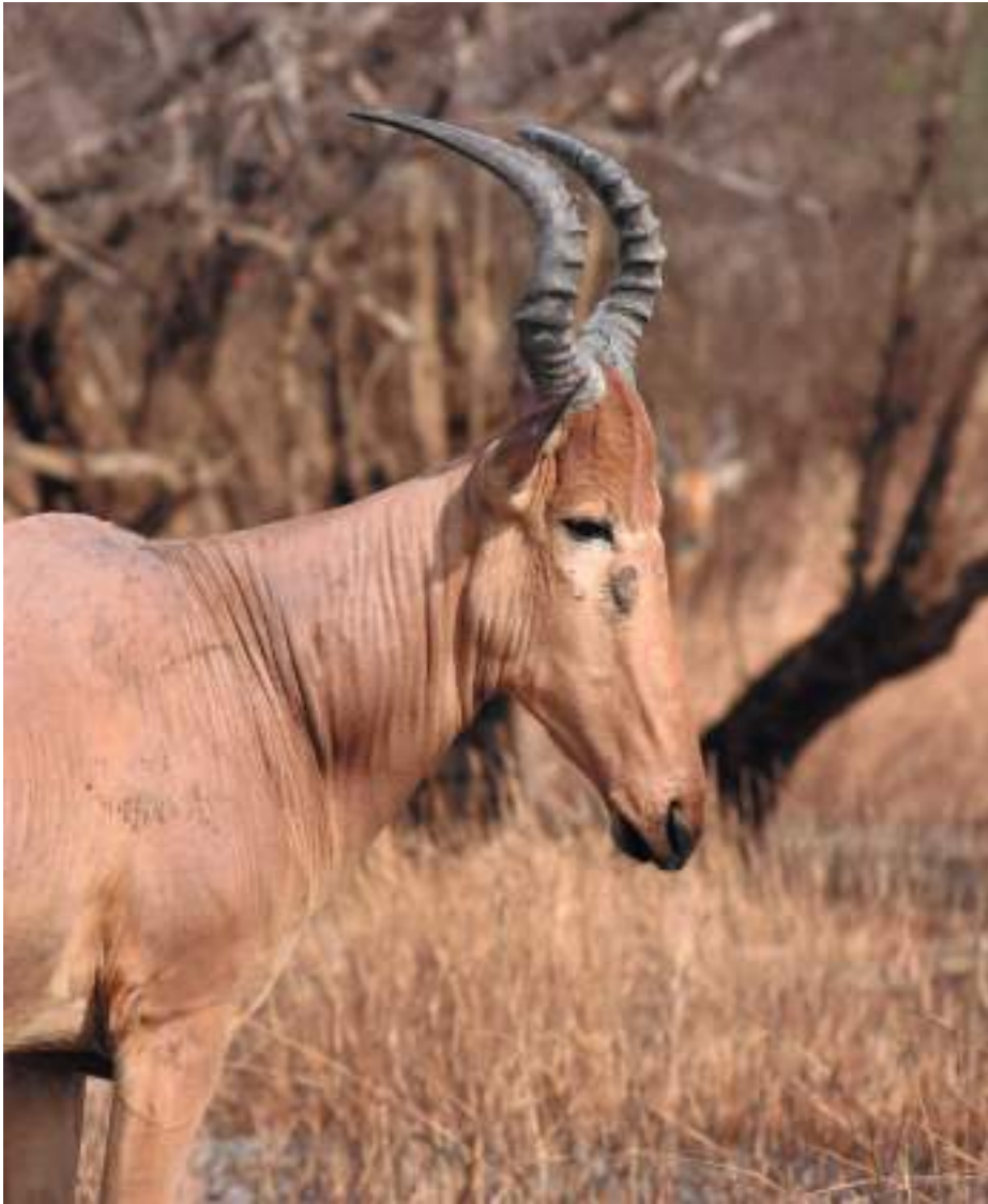
Planche 37. Alcelaphus lichtensteinii , l'antilope Bubale.