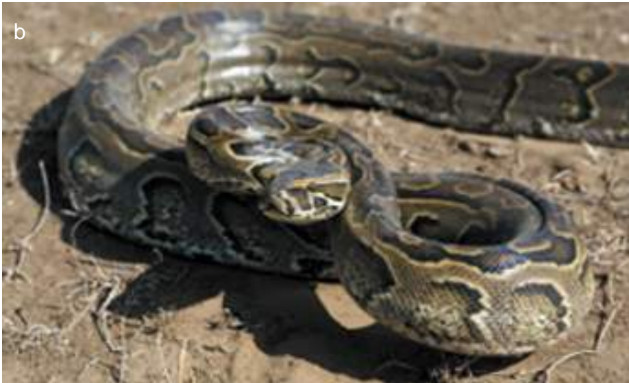
Planche 42. Crocodylus niloticus Laurenti (a), le crocodile du Nil, observé à la mare Bali. Python sebae , le python (b), dans les ravins de la piste 1, vers la Yanguali. Photo DPNP, 2012.