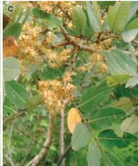
Planche 14. Vue globale de la savane arborée à Burkea africana (a) dans la RBP.

Detarium microcarpum (b et c) dans les terroirs riverains de la Pendjari, RBP : aspect de l'arbre (a) ; rameaux portant des feuilles et fleurs (b).