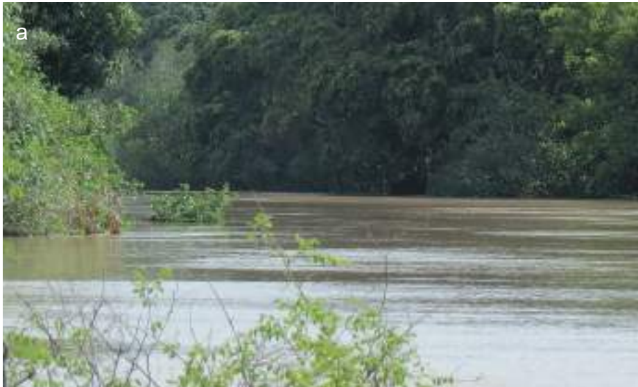
Planche 27. Forêt galerie à Cola laurifolia et Parinari congensis le long de la rivière Pendjari.

Sur les talus des berges de rivière, la forêt galerie dite « rupicole » supporte le courant fort de l'eau lors des périodes de crues. Cette