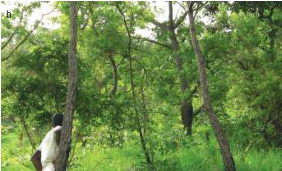
Planche 22. Fruit de Pseudocedrela kotschy (a) sur la piste de la Bondjagou, noyau central de la Pendjari, RBP.

Vue globale de la savane boisée à Bombax costatum (b) au pied de la chaîne de l'Atacora le long de la piste Tanguiéta-Batia dans les terroirs riverains de la Pendjari, RBP.