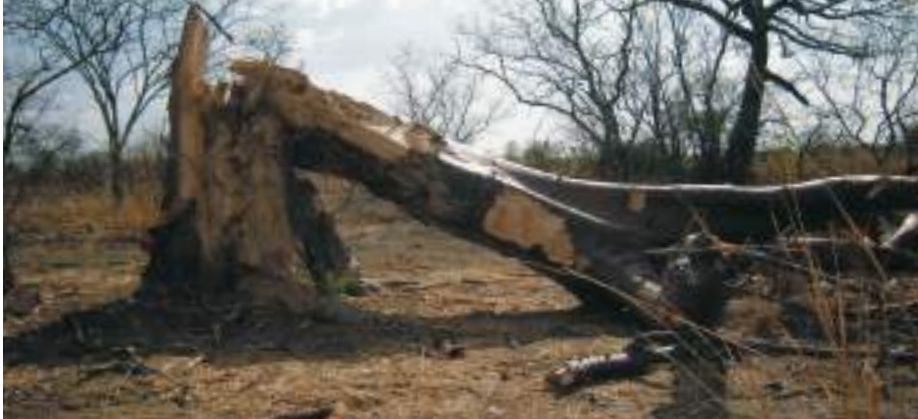
Planche 45. Baobab écorcé et cassé par des éléphants.

Les savanes boisées abritent également le bubale, le topi et le céphalophe. On peut aussi avoir la chance d'y observer le galago du Sénégal.