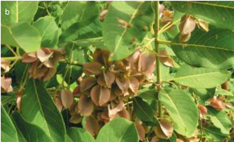
Planche 13. Combretum collinum (a et b) en fruits dans une savane arbustive de la Zone Cynégétique de la Pendjari, RBP.