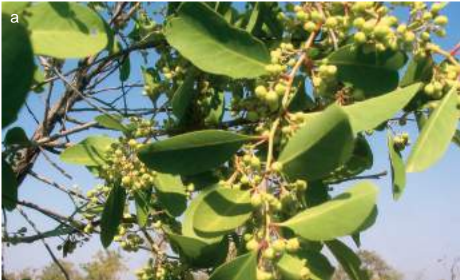
Planche 11. Gymnosporia senegalensis (syn. Maytenus senegalensis ), arbuste épineux rencontré souvent dans les savanes de la RBP. Il est abondant sur les sols gravillonneux.