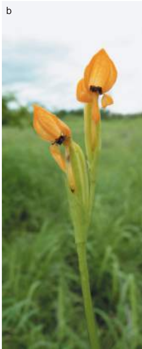
Planche 8. Platycoryne paludosa , une orchidée des savanes marécageuses, observée sur le Circuit Fogou, RBP : plante entière (a), inflorescence (b).