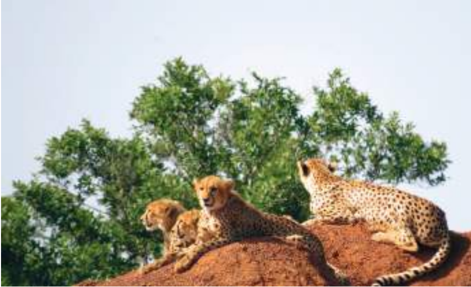
Planche 3. Famille de guépard ( Acinonyx jubatus ) sur un tas de sable dans le PNP.