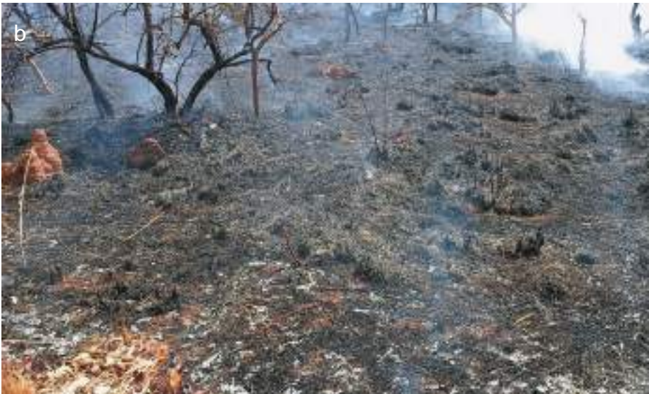
Planche 50. Essai d'allumage du feu précoce, montrant son effet sur les herbes qui sont brûlées et son inaction sur les arbres dans la RBP.

Feu tardif allumé (b) dans la savane arborée, dans le cadre des expériences menées par l'UAC dans la RBP en avril 2017.