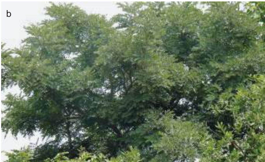
Planche 20. Savane arborée saxicole dominée par Burkea africana et Detarium microcarpum sur flanc de colline (a)

Vue rapprochée de Burkea africana avec Detarium microcarpum et Pteleopsis suberosa dans la savane arborée saxicole (b) des environs de la Bondjagou dans la RBP.