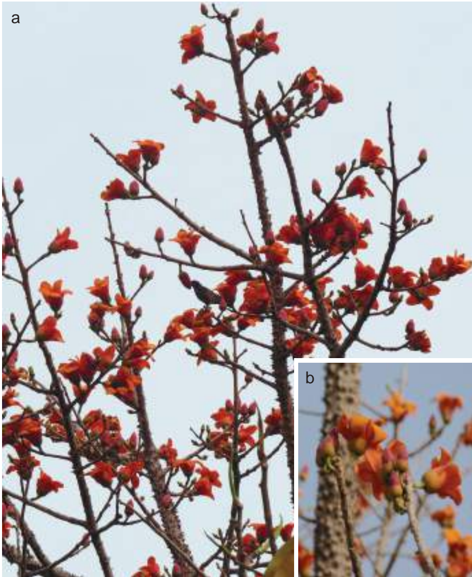
Planche 23. Bombax costatum (a) ou Kapokier à fleurs rouges de savane en floraison dans la zone cynégétique de Batia (b). Les sépales sont utilisés pour faire la sauce. Ils sont aussi vendus sur les marchés de la zone soudanienne.