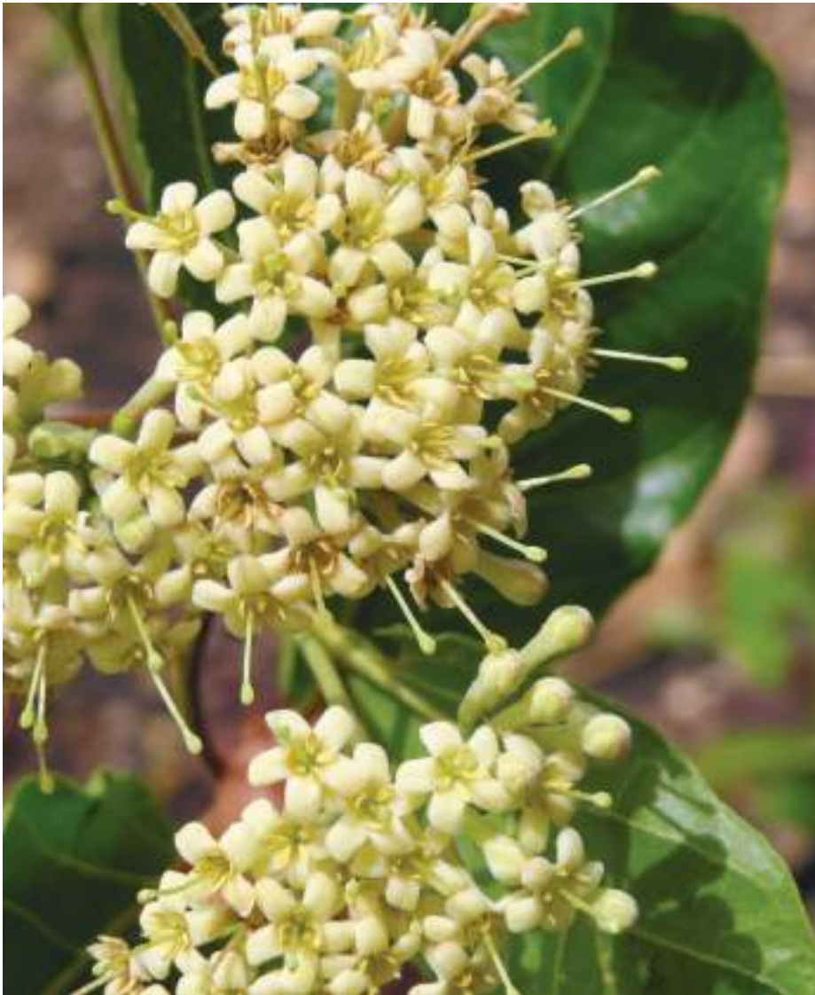
Planche 17. Crossopteryx febrifuga en floraison dans la première moitié de la saison des pluies.