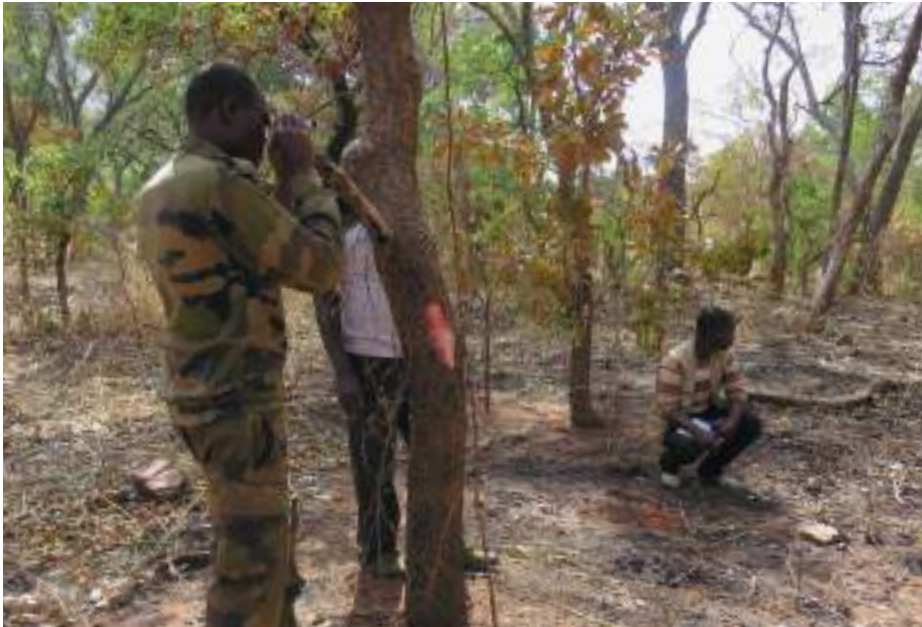
Planche 49. Installation des placeaux permanents de suivi du feu par les acteurs de gestion de la RBP dans une savane arborée.

Le dispositif expérimental de base comprend 10 placeaux permanents d'un hectare chacun qui ont été délimités et sécurisés par des bornes et un layonnage dans les divers types d'habitats du RBP (Pl. 49). Les coordonnées de ces placeaux figurent en annexe 2.