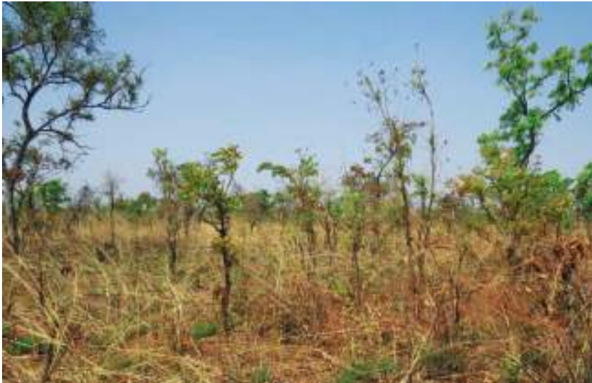
Planche 12. Vue globale de la savane arbustive à Combretum collinum et Andropogon gayanus var. gayanus (b) au début de la saison sèche dans la RBP