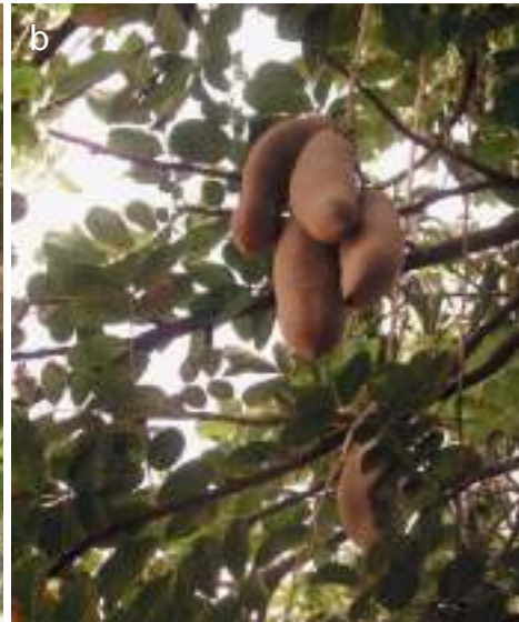
Planche 25. Kigelia africana , le fruit (a et b) a la forme d'un saucisson.