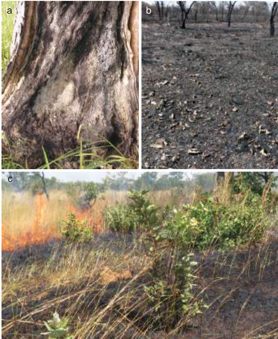
Planche 48. Effet du feu tardif sur Daniellia oliveri (a) dans les terroirs riverain de la RPB en 2015

Régression de la couverture des arbres (b) sous l'effet du feu tardif dans la RPB en 2015.