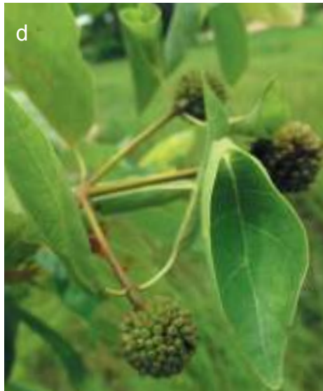
Planche 19. Sarcocephalus latifolius ; inflorescence (a), fruit vert (b) observés dans la savane humide le long de la rivière Pendjari, noyau central de la RBP. (© Agbani 2014)

Mitragyna inermis : fleur (c) ; fruits (d) dans la savane humide de la réserve vers la mare Yangouali. (© Agbani 2014)