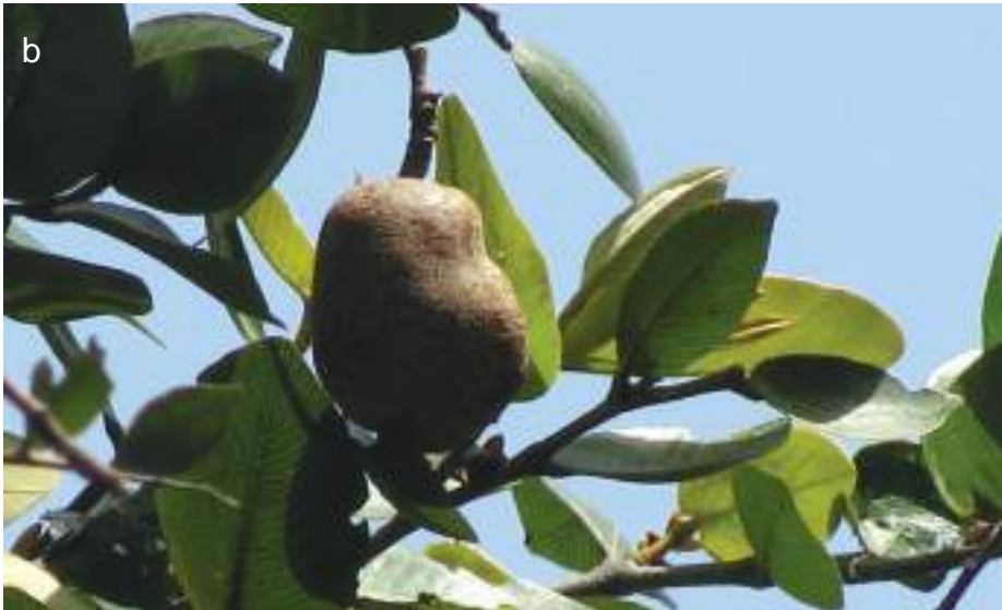
Planche 28. Parinari congensis feuilles (a) et fruit (b) observés le long de la rivière Pendjari dans le noyau central de la Pendjari, RBP.