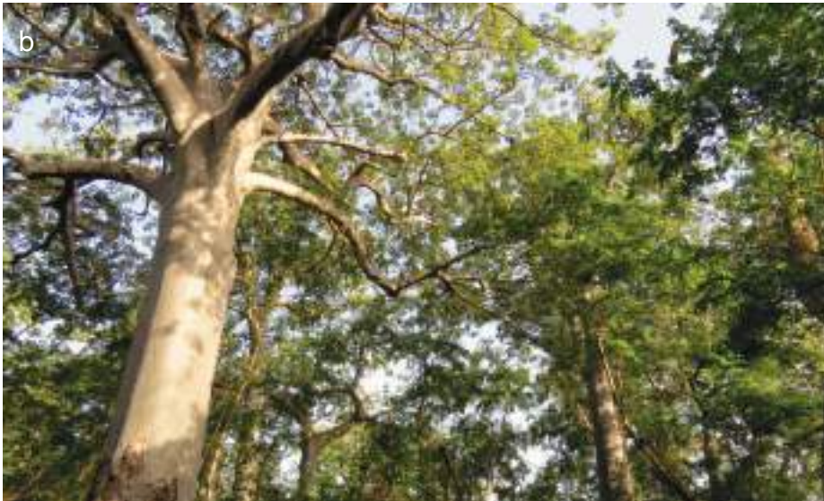
Planche 24. Forêt claire à Anogeissus leiocarpus dans la zone cynégétique de la Pendjari (a).

Forêt claire à Adansonia digitata (b) et Anogeissus leiocarpus dans le noyau central de la Pendjari, RBP.