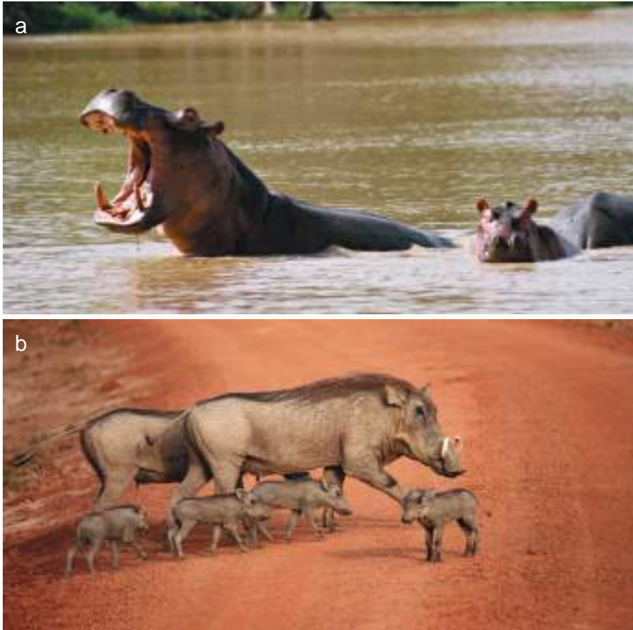
Planche 38. Hippopotamus amphibius (a), l'hippopotame, dans la mare sacrée. Phacochoerus aethiopicus (b), le phacochère commun, en famille traversant la piste 1 entre le poste Arly et la mare sacrée. Photo DPNP, 2012.

Les hippopotames (Pl. 38a), phacochères (Pl. 38b), babouins (Pl. 39a) et patas (Pl. 39b), contribuent également à cette diversité mammalienne. Des illustrations respectives de ces groupes d'animaux sont présentées ci-après.